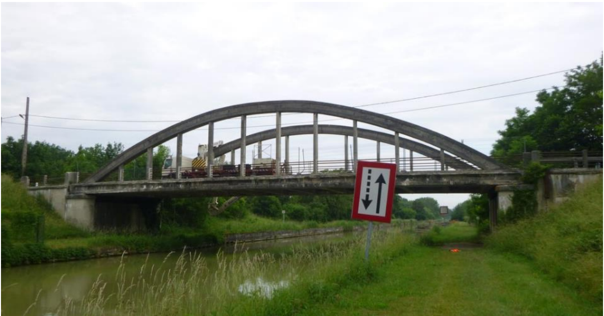
L'ouvrage d'art n°D0493 RD967 franchissant le canal de l'Oise à l'Aisne (commune de Bourg-et-Comin)

Dès le 10 octobre, un plan de déviation sera mis en place afin de permettre le déroulement des travaux sur le pont franchissant le canal de l'Oise à l'Aisne sur la RD967.