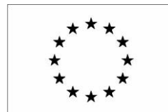
Version noir et blanc

2/ Faire mention au soutien du Fonds social européen en complément des logos de signature.